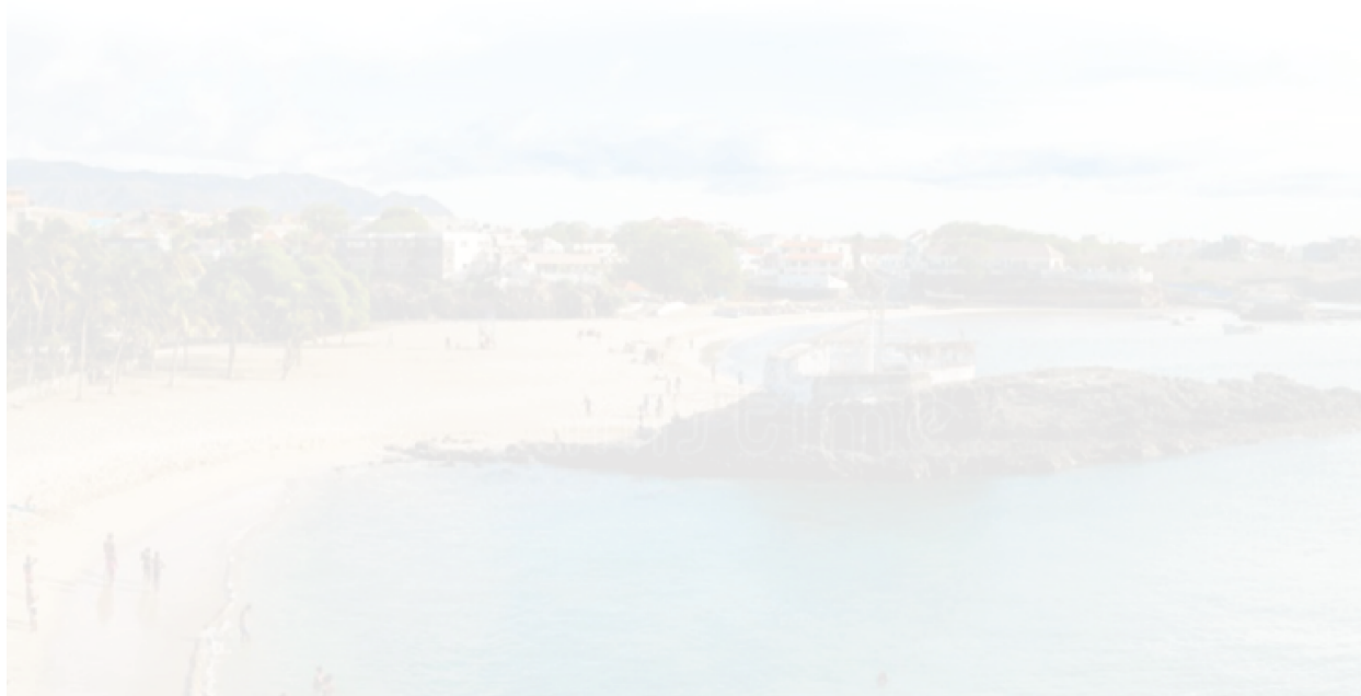
Figura 1: Zonas e Lugares Concelho do Tarrafal