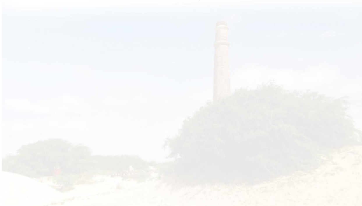
Figura 1: Zonas de Lugares Boavista