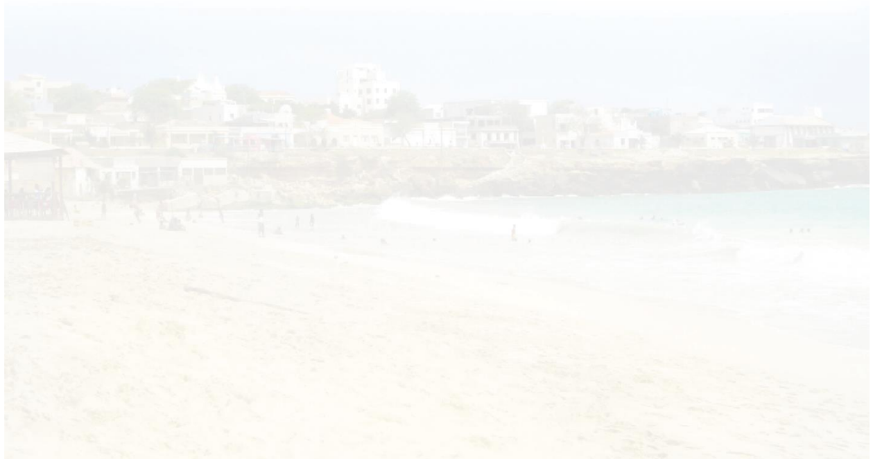
Figura 1: Zonas e Lugares Maio