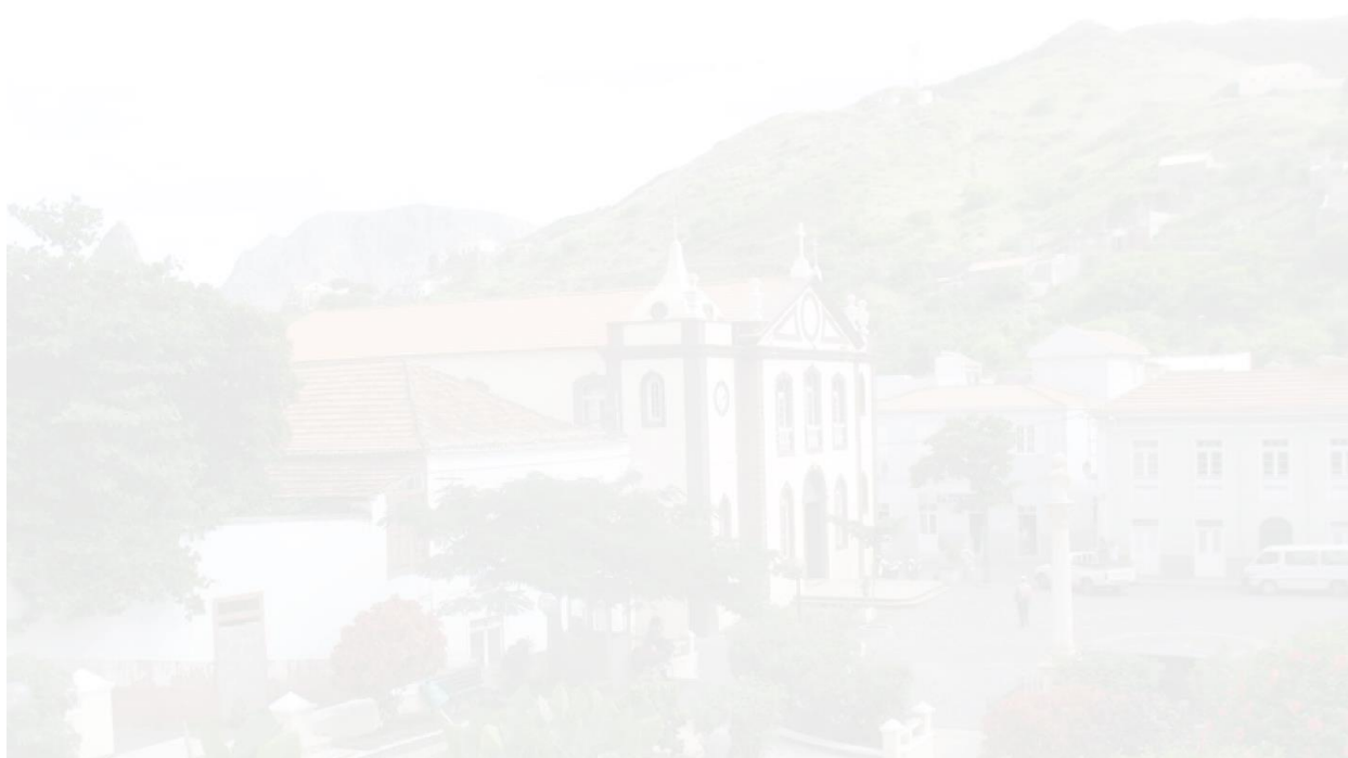
Figura 1: Zonas e lugares Concelho de R. Brava