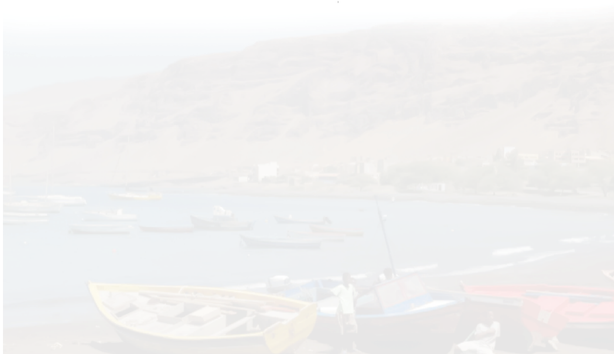
Figura 2: Zonas e Lugares Concelho do Tarrafal de S. Nicolau