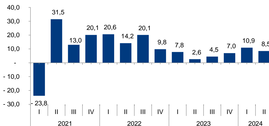
Taxa de variação homóloga do PIB em volume (%)

No 2º trimestre de 2024, o PIB registou uma variação homóloga positiva de 8,5% em termos reais, taxa inferior em 2,4 pontos percentuais (p.p.) à verificada no 1º Trimestre de 2024.